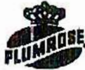
FOTO DE ETIQUETA DEL PRODUCTO

GESTIÓN: INSPECCIÓN DE PRODUCTO TERMINADO