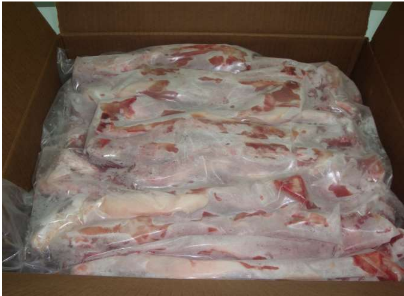
FOTO DE VISTA SUPERIOR INTERNA DEL PRODUCTO CONGELADO EMPACADO Y ENCAJADO

GESTIÓN: INSPECCIÓN DE PRODUCTO TERMINADO