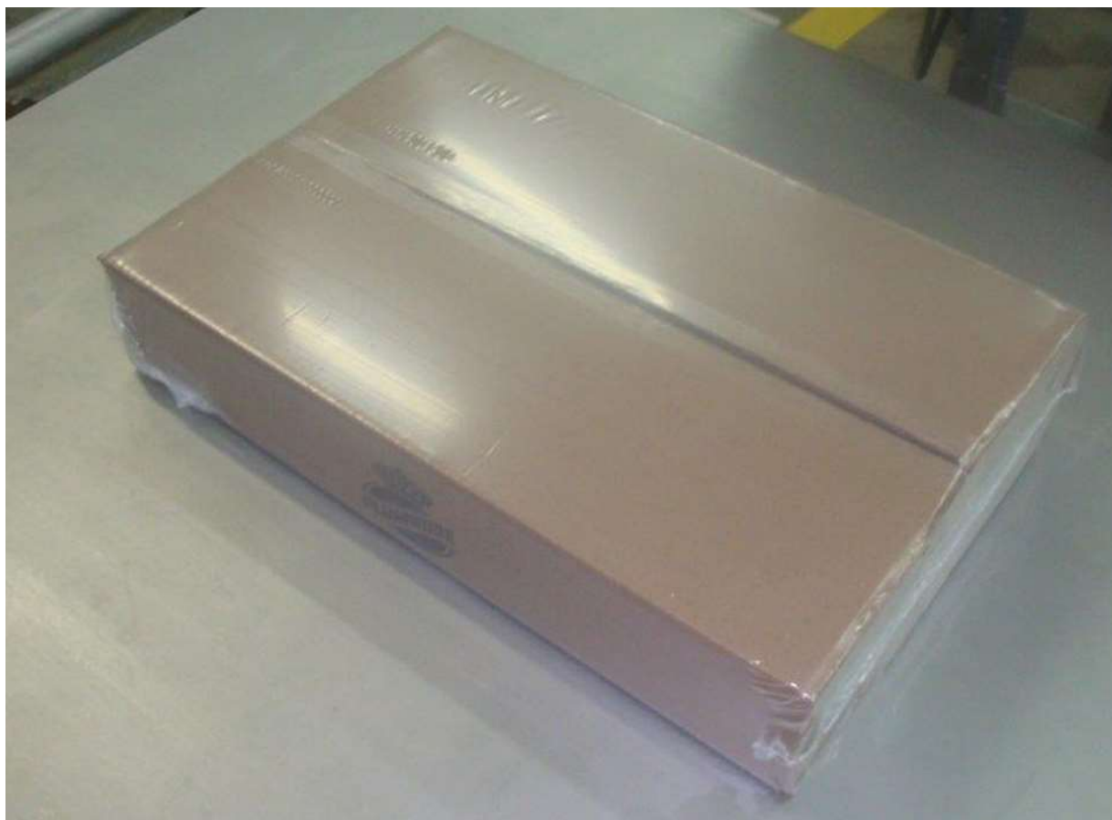
FOTO DE VISTA SUPERIOR EXTERNA DEL PRODUCTO, ENCAJADO Y EMBALADO

GESTIÓN: INSPECCIÓN DE PRODUCTO TERMINADO