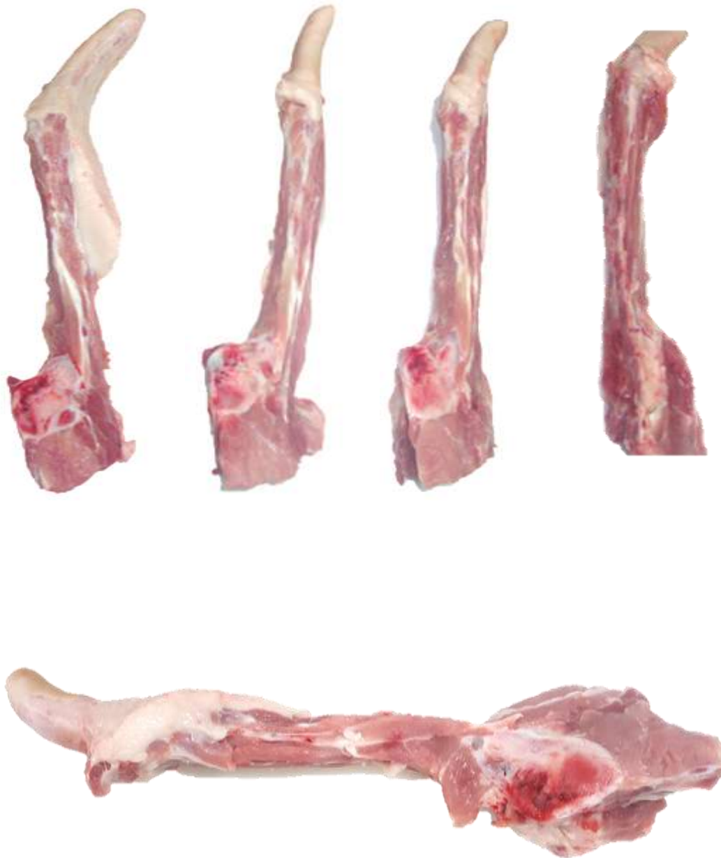
FOTO DE VISTA EXTERNA DEL PRODUCTO FRESCO

GESTIÓN: INSPECCIÓN DE PRODUCTO TERMINADO