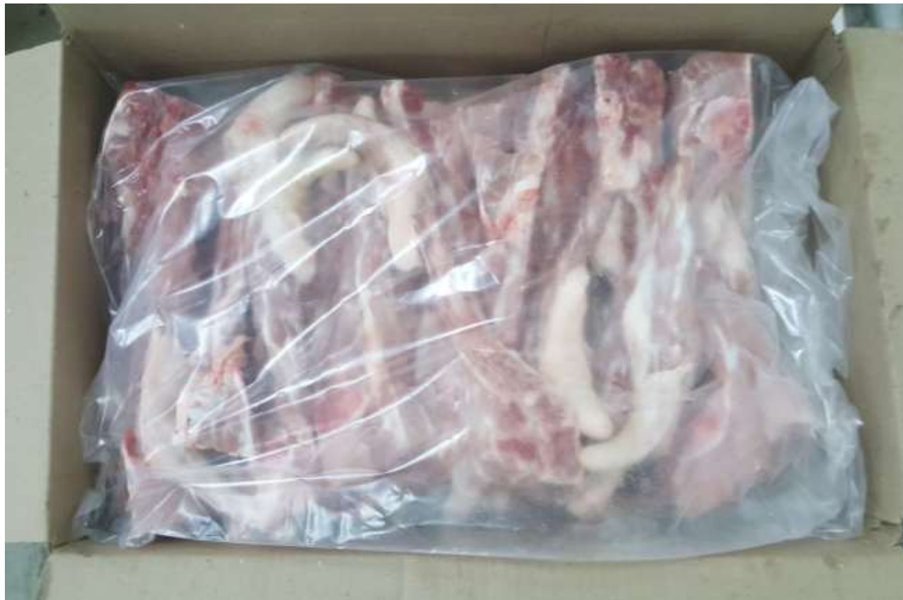
FOTO DE VISTA SUPERIOR INTERNA DEL PRODUCTO FRESCO ENCAJADO Y EMPACADO

GESTIÓN: INSPECCIÓN DE PRODUCTO TERMINADO